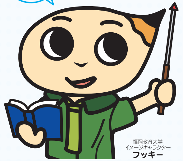
福岡教育大学 イメージキャラクター フッキー

日時 ▶ 平成29年11月12日(日) 場所 ▶ 福岡教育大学 10時～16時 (宗像市赤間文教町1-1)