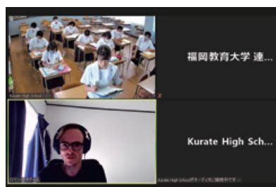
福岡県立鞍手高等学校とのリモート多文化交流会（令和2年8月実施） Remote intercultural exchange meeting with Fukuoka Prefectural Kurate High School (August 2020)

※は令和元年度における実績。令和2年度については、新型コロナウイルスの影響により中止となった。 The events marked with an asterisk were held in academic year 2019. They were canceled in academic year 2020 because of the COVID-19 pandemic.