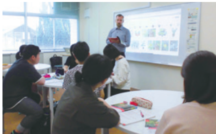
ELI講座A2クラス A2 level class

実践的な会話練習を中心とした1回90分、週1回のレッスンによって、英語コミュニケーション能力の向上を目指します。