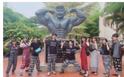
マレーシア短期英語研修 Short-term English program in Malaysia

The trip to Malaysia, a multi-cultural, multi-lingual, multi-ethnic and multi-religious country, aims to give participants a global perspective and improve their ability to communicate in English.