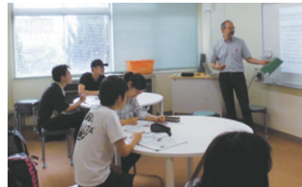
ELI講座B1クラス B1 level class

Ability to communicate in English will be improved by weekly 90-minute lessons focusing on practical conversation.