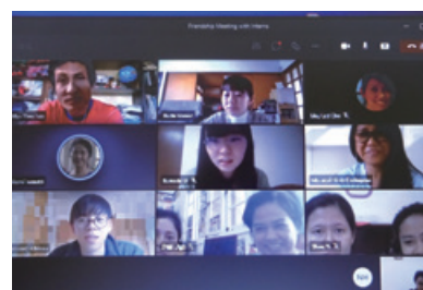
2021年度ミャンマーインターンシップリモート研修（令和3年3月実施） 2021 Myanmar internship remote workshop (March 2021)