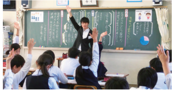
教育実習 Student teaching