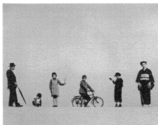
《パパとママと子供たち 1949年》

(問8) 下右のインスタレーション作品《掌の鍵》(ヴェネツィア・ビエンナーレでの展示)の作者を選びなさい。