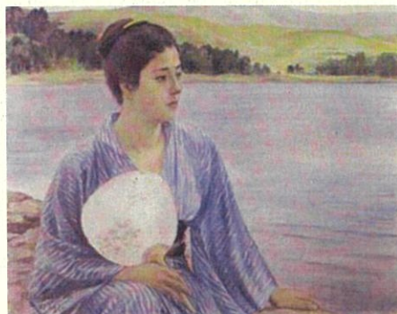
(問 10) 《湖畔》