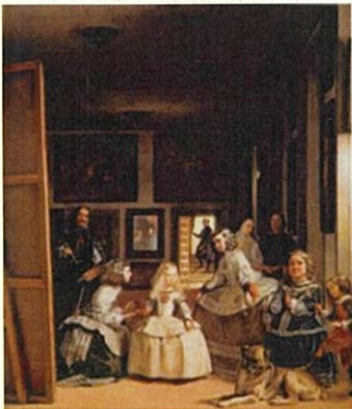
(問 19) 《女官たち》