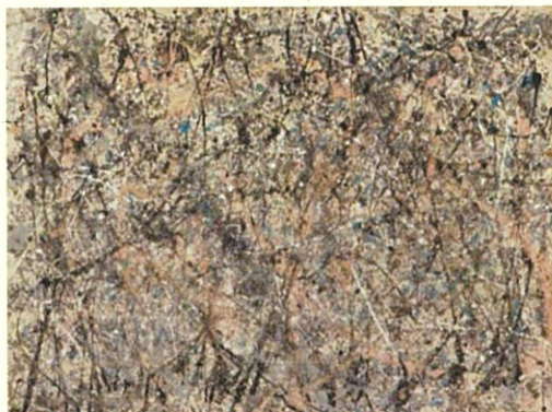
(問 24) 《ナンバー1 ラベンダーミスト》