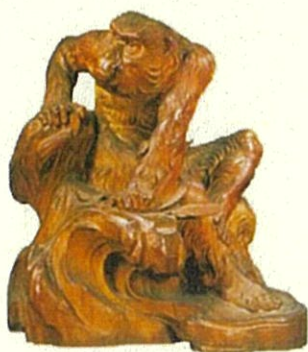
(問 9) 《老猿》