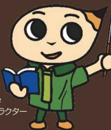
福岡教育大学 イメージキャラクター フッキー