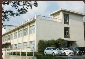
教育総合研究所 →Map 14