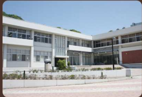
共通講義棟 →Map 26