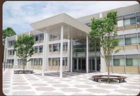
教育・心理教棟 学術情報センター図書館 →Map 5 6