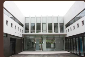
ものづくり創造教育センターA棟 →Map 34