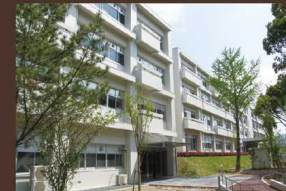
自然科学教棟 →Map 27